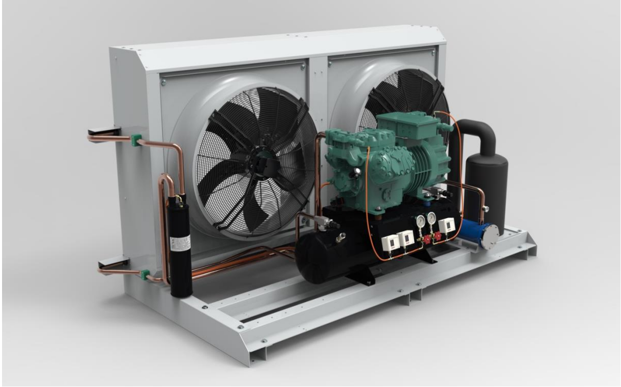
Unidad condensadora con compresor Bitzer