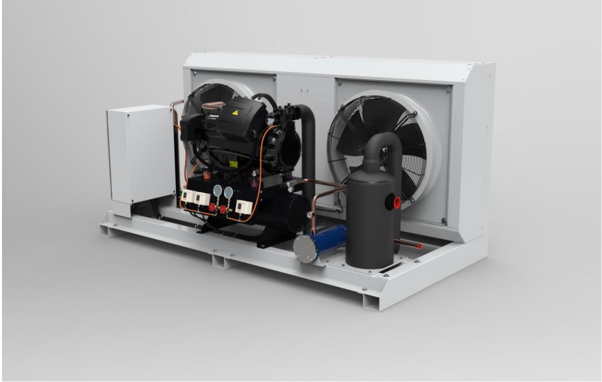
Unidad condensadora con compresor Copeland